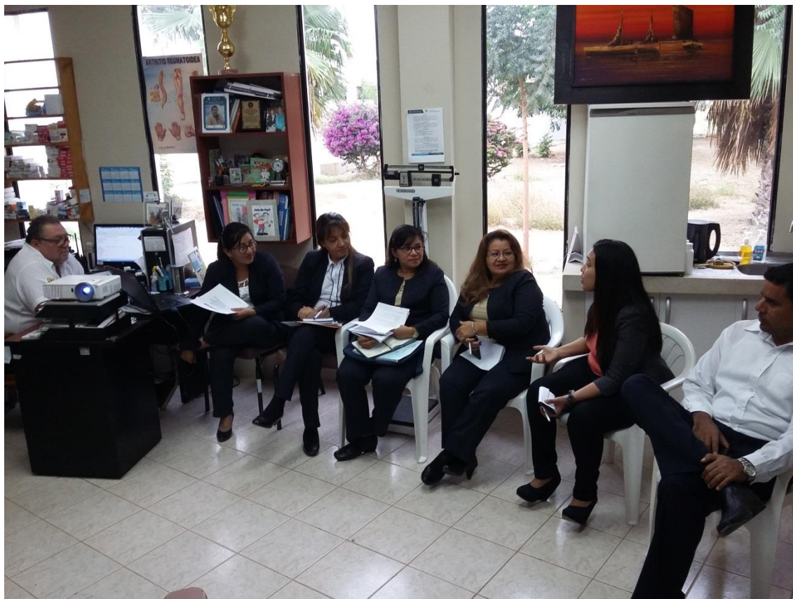
Fase de acompañamiento con los responsables de actividades