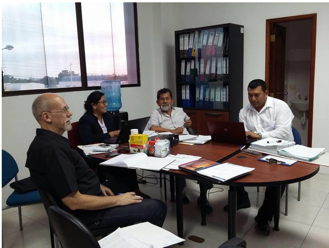
Instituto de Investigación Científica y Desarrollo Tecnológico