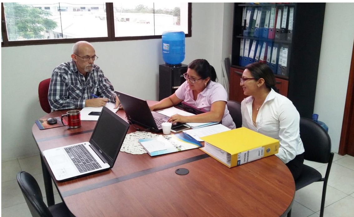
Instituto de Investigación Científica y Desarrollo Tecnológico