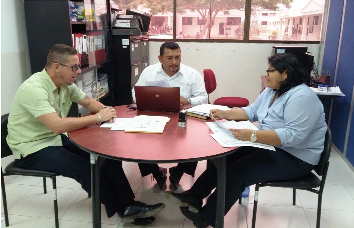
Departamento de Vinculación con la Colectividad