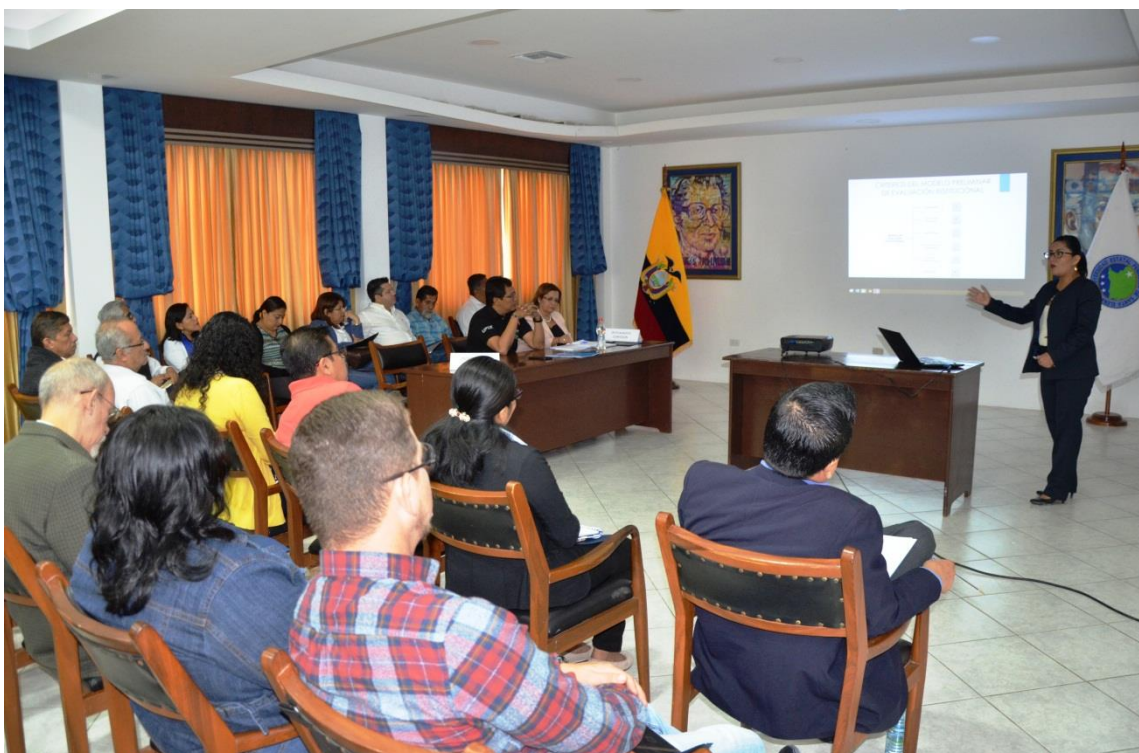
Socialización del Plan de Acción Institucional 2017 - 2018